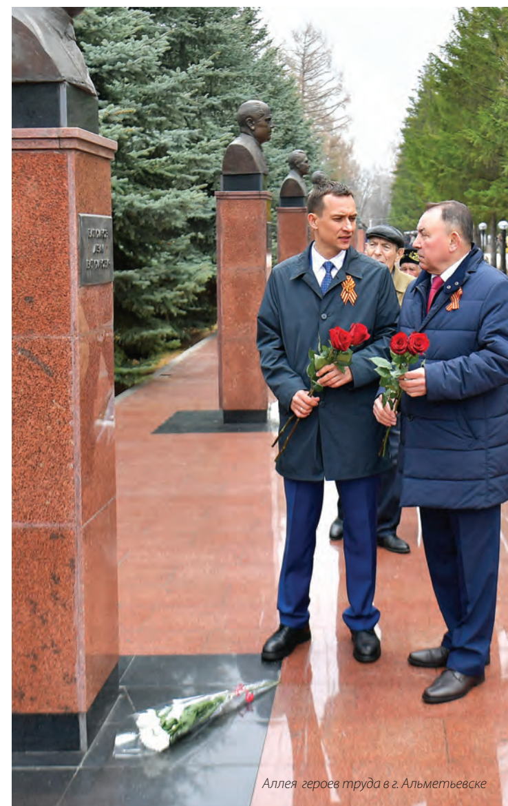
Аллея героев труда в г. Альметьевске

– У нас более 11 тысяч профсоюзных активистов, которые являются уполномоченными по охране труда, профгруппами, председателями цеховых профсоюзных организаций. Последних я бы выделил особо: это и ноги, и руки, и глаза, и душа коллектива. Председателя цеховой профсоюзной организации члены Профсоюза избирают открытым голосованием на собрании (в цеху – от 70 до 140 человек). Он выполняет роль посредника в переговорах с работодателем, является советником для работника по всем вопросам – от производственных до семейных. Поэтому их просьбы для коллектива стараюсь выполнять и очень ценю этих людей: от них напрямую зависит производительность труда. Миссия профсоюзного лидера – благоприятный климат в коллективе и спокойная душа работника.