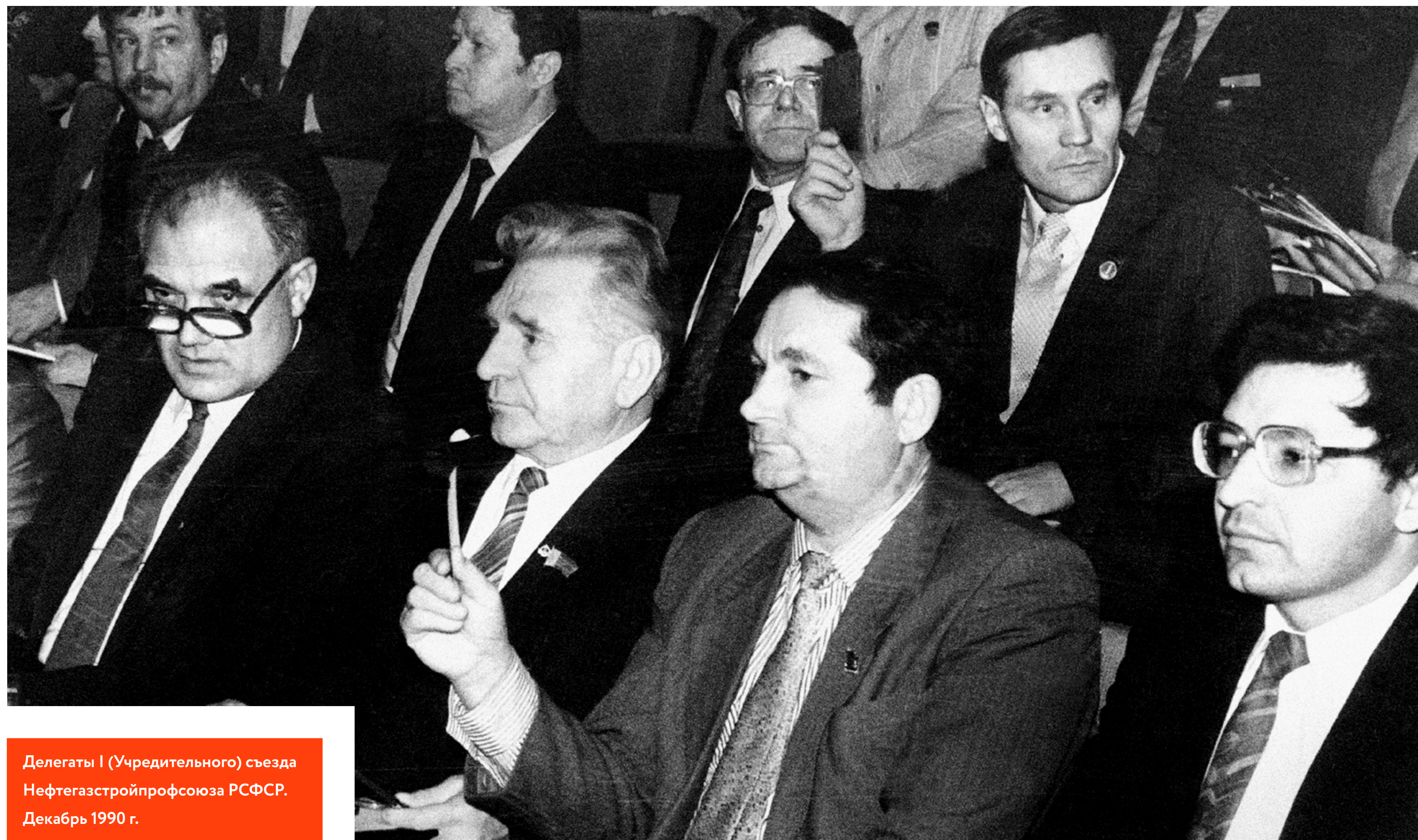
Делегаты I (Учредительного) съезда Нефтегазстройпрофсоюза РСФСР. Декабрь 1990 г.