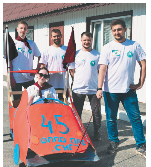
Они могут всё

Всем без исключения участникам двухдневного культурно-массового мероприятия были вручены дипломы. Но главное достижение профсоюзного форума нефтяников заключается в том, что в конечном итоге победили дружба и сплочённость между командами, солидарность, единый корпоративный командный дух и устремлённость к покорению новых высот.