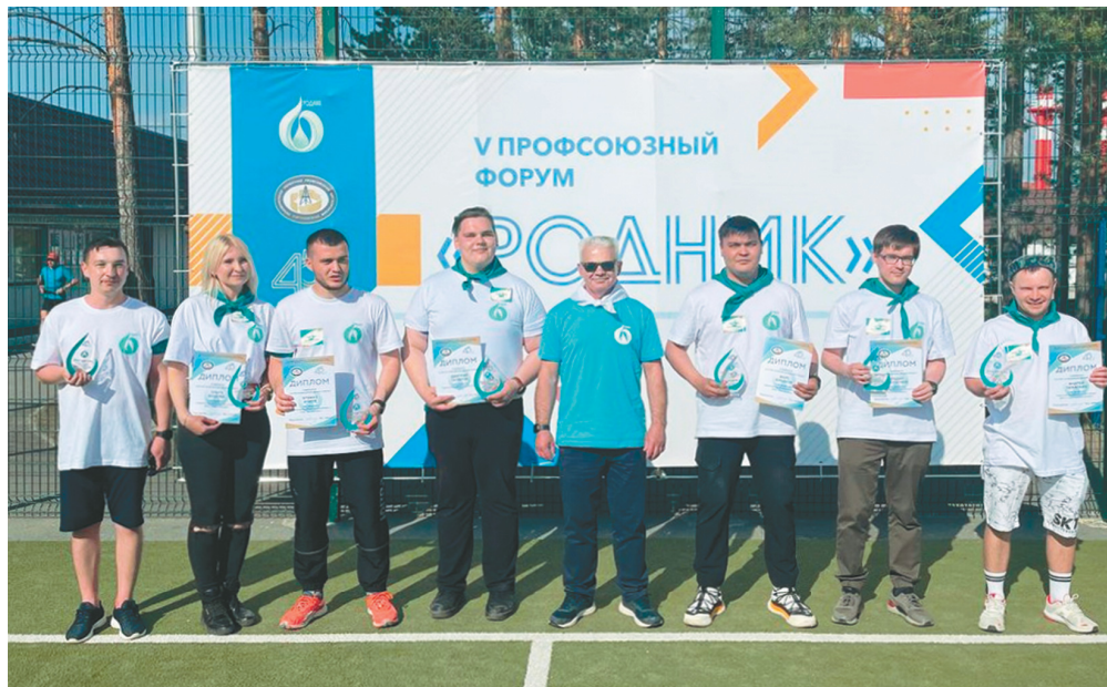
Команда-победитель «Я, ты, море»