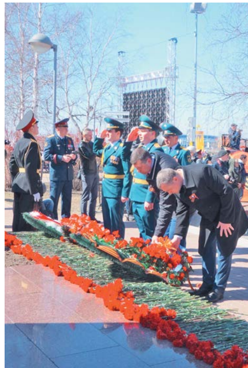
Возложение венков у Вечного огня мемориала Славы, 2019 год