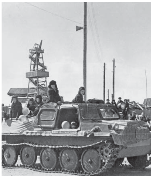
Первомай в Сургуте, 1966 год

Газета «Профсоюзный выбор» приняла участие в этой акции и разместила в соцсетях уникальные фотоснимки о первомайских демонстрациях, которые проводились в разные годы в Сургуте. Предлагаем вниманию читателей некоторые из них.