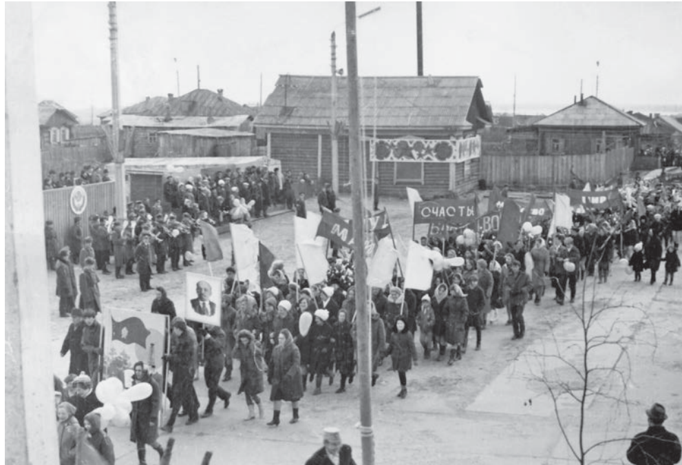
Первомайская демонстрация в Сургуте, 1960-е годы