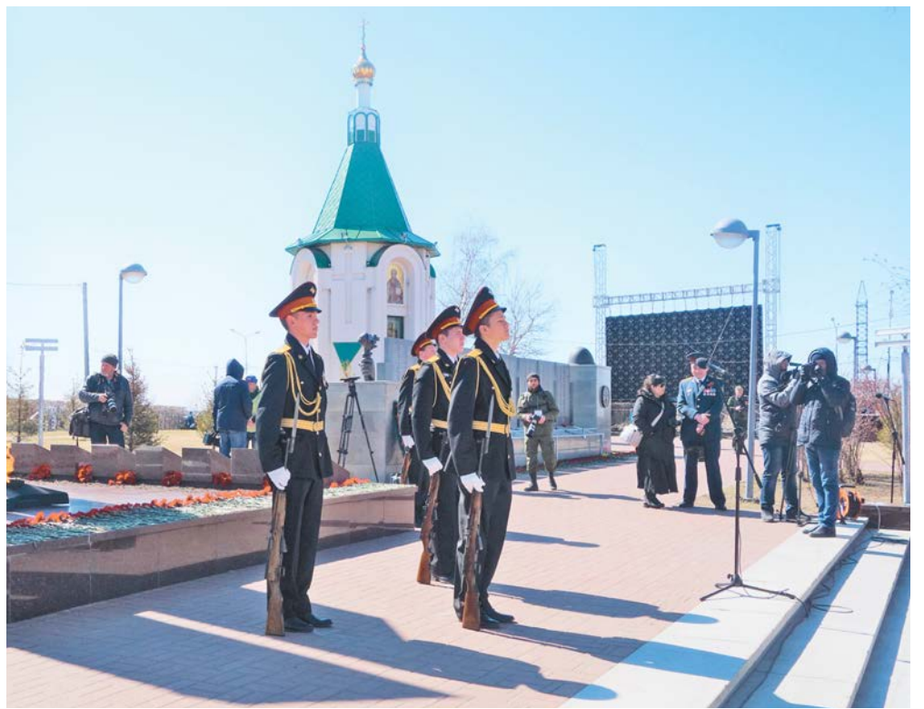
Почётный караул у Вечного огня мемориала Славы, 2019 год

Особой заботой профсоюзов в годы войны стали осиротевшие дети. При профсоюзной поддержке было создано