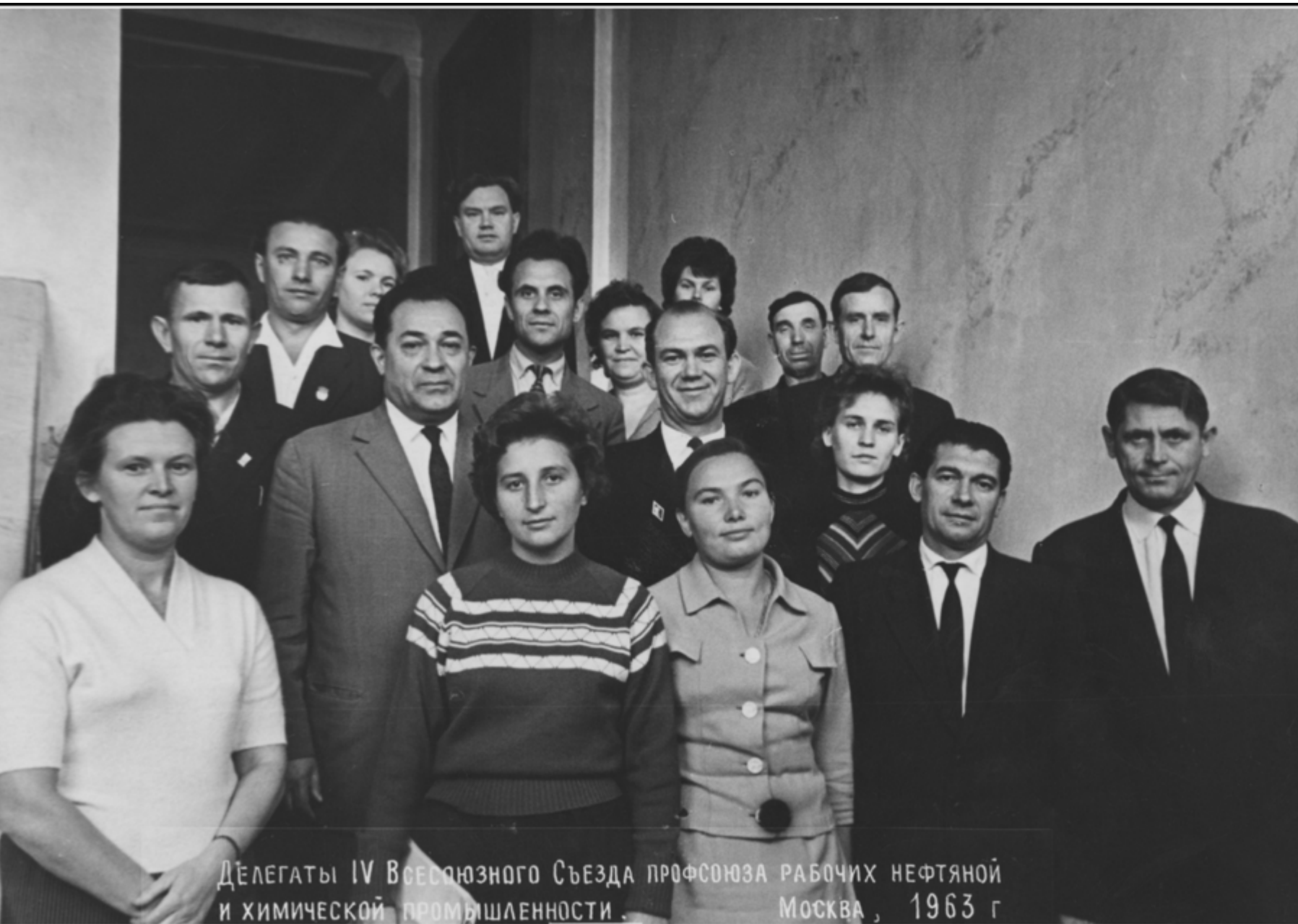
ДЕЛЕГАТЫ IV ВСЕСОЮЗНОГО СЪЕЗДА ПРОФСОЮЗА РАБОЧИХ НЕФТЯНОЙ И ХИМИЧЕСКОЙ ПРОМЫШЛЕННОСТИ. Москва, 1963 г.

ОТИЗ, а через два года и объединенного планово-производственного отдела. С 1980 года здесь начинается моя профсоюзная работа – избрали членом профкома и председателем цеховой профорганизации аппарата института.