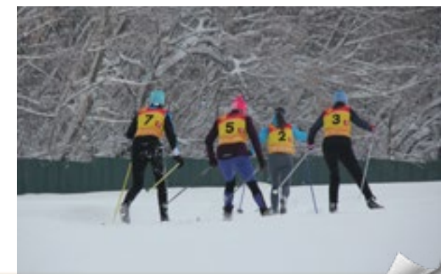
Моя профсоюзная карта