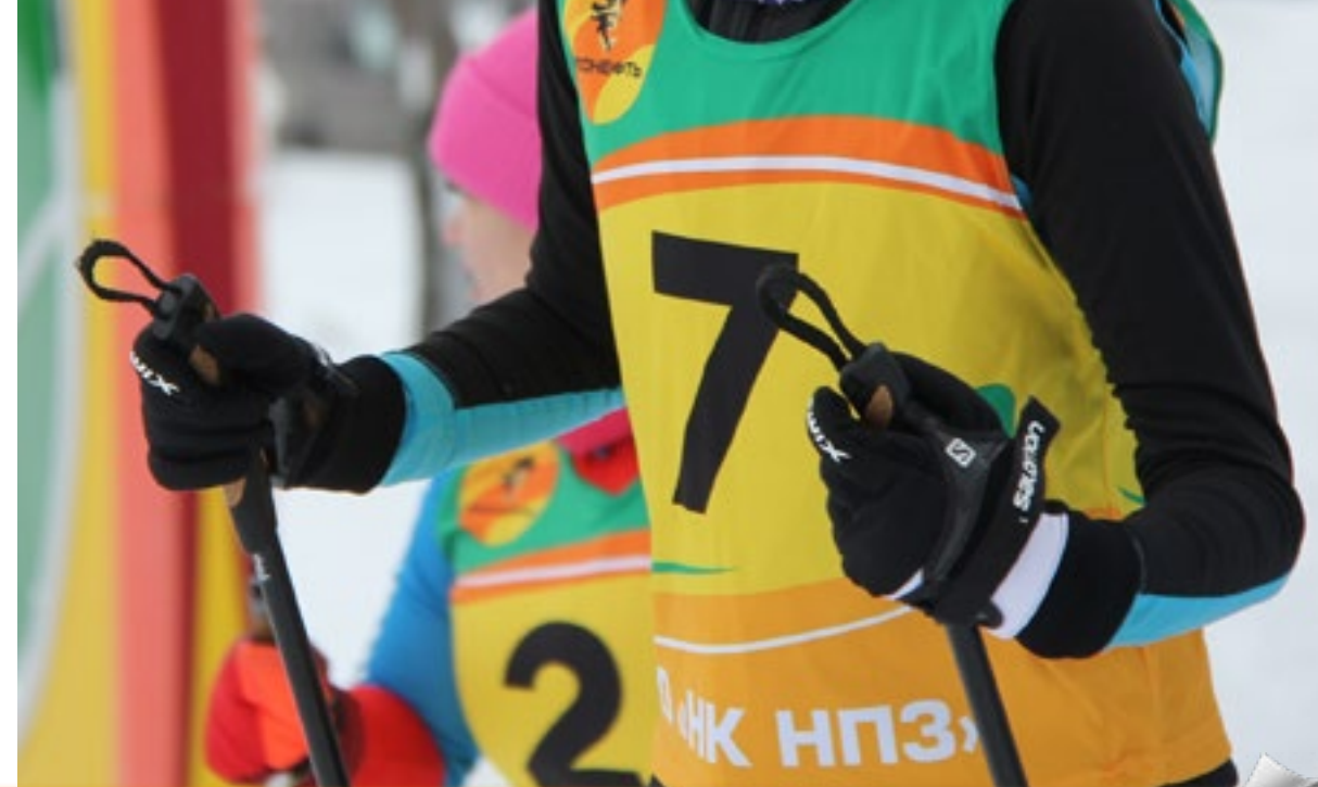
Новости структурных организаций