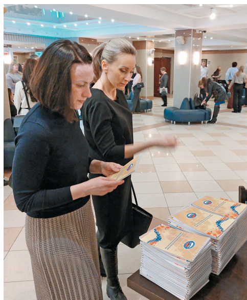
Подготовка к семинару