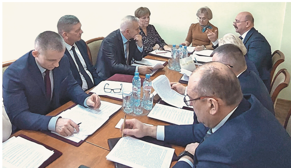
Заседание комитета районной организации

В структуре районной организации профсоюза насчитывается 67 первичных профсоюзных организаций и одна объединённая первичная профсоюзная организация. С первичными профсоюзными организациями, взаимодействующими по заключённым соглашениям, – 71 первичная профсоюзная организация и одна объединённая первичная профсоюзная организация.