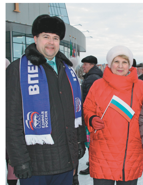
На городском митинге, 2019 год

Она акцентировала внимание присутствовавших делегатов и гостей конференции