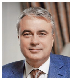
Павел Завальный Президент Союза организаций нефтегазовой отрасли «Рос- сийское газовое общество»