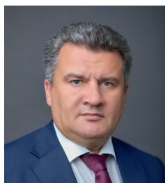
Александр Корчагин Председатель Нефтегазстройпрофсоюза России