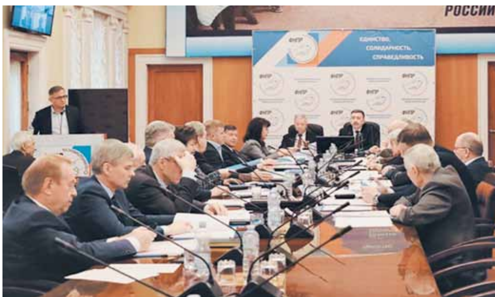
Заседание исполкома ФНПР

Членским организациям ФНПР Исполком ФНПР рекомендовал: принять участие