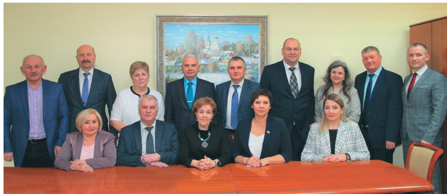
Комитет районной организации, 2022 год

Численность молодых членов профсоюза составляет 32 812 человек (30%). Высокий уровень охвата профсоюзным членством в ОППО ПАО «Сургутнефтегаз» – 91,5%, в ОППО «Газпром трансгаз