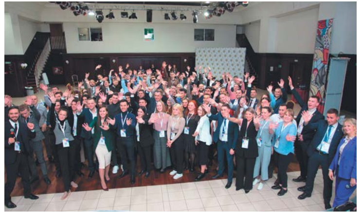
Мы – единое целое

В роли преподавателей практических занятий выступили ведущий специалист социально-экономического отдела аппарата Нефтегазстройпрофсоюза России, член