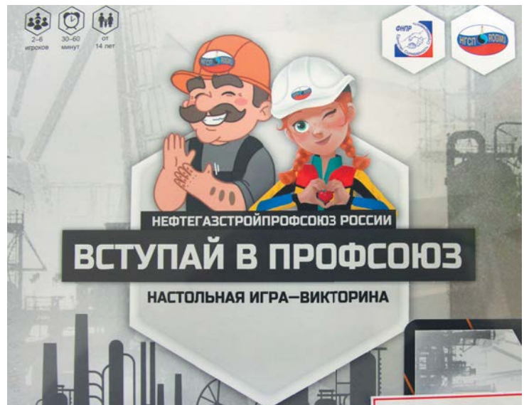
Упаковка с игрой

В игре используются кубики, жетоны, карточки с вопросами. Вначале участники каждой команды ходят – по очереди бросают кубики, ставят их на свою клетку, в которой сообщается, какую карточку нужно тянуть. Вытащив её, читают записанный на ней вопрос. Каждый для себя определяет, будет ли он членом профсоюза или нет. Член профсоюза, попадая на определённые клетки, например, «опасность», достаёт карточку. В ней написано о том, что человек