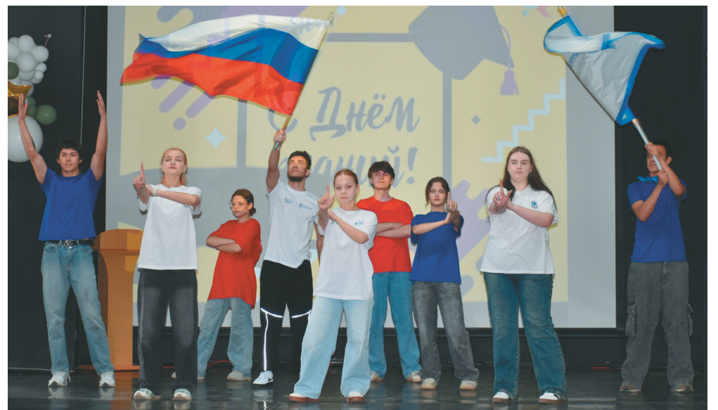
Творческий коллектив института

В ходе мероприятия с концертными номерами выступили студенческие творческие