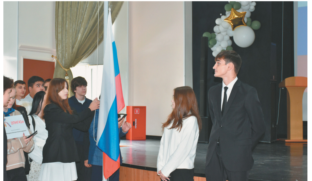
Поднятие Государственного флага Российской Федерации