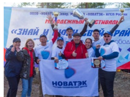
Моя профсоюзная карта