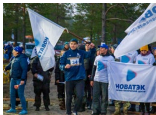
Новости структурных организаций