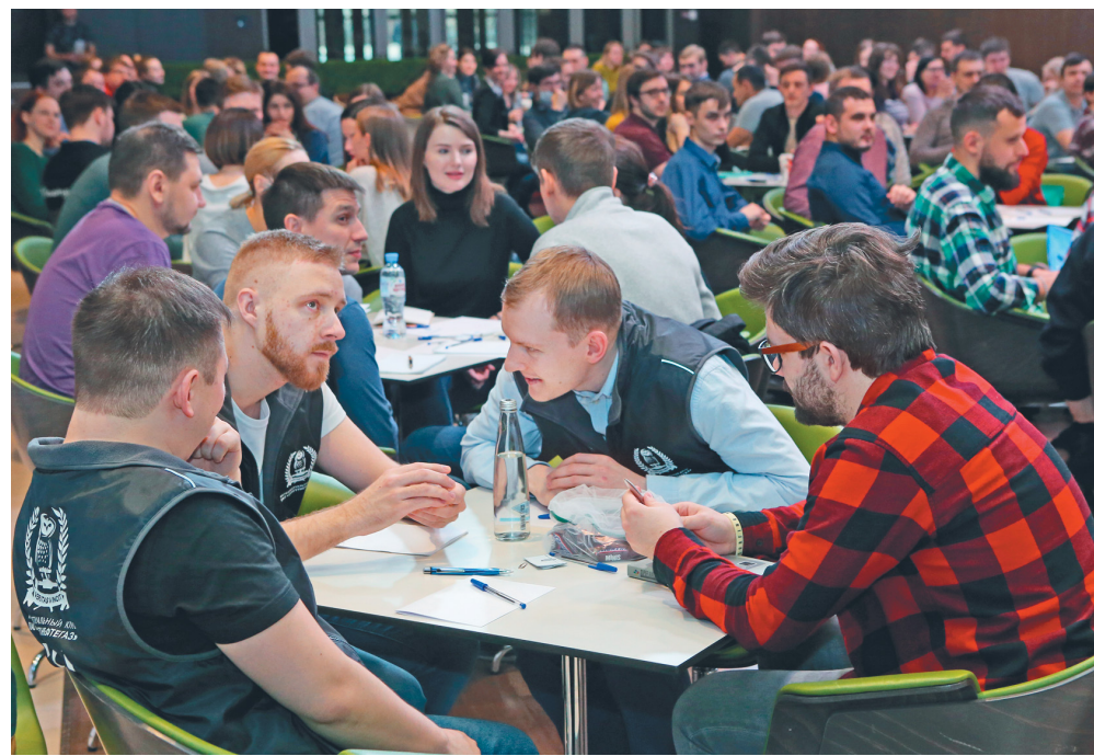
Интеллектуальная игра «Ринг эрудитов», 2020 год

Учитывая эпидемическую обстановку, совет молодёжного объединения провёл работу по изменению форматов мероприятий и разработал план работы на 2021 год, в котором предложены новые и учтены все традиционные мероприятия по основным направлениям деятельности.