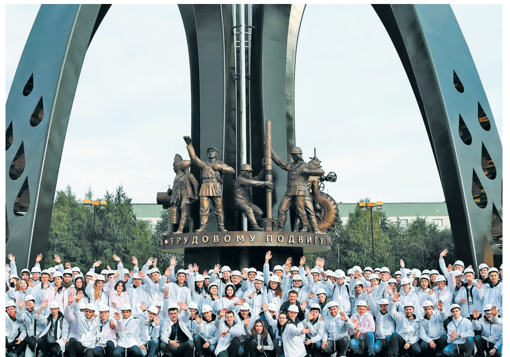
Посвящение в нефтяники, 2019 год

Совет молодёжного объединения провёл ряд фотоконкурсов, челленджей, экологических акций, марафон видеороликов социальной рекламы «Всё в твоих руках» и многое другое удалённо, на площадках групп в социальных сетях «ВКонтакте» (vk.com/sng_mo) и Instagram (@mo_sng).