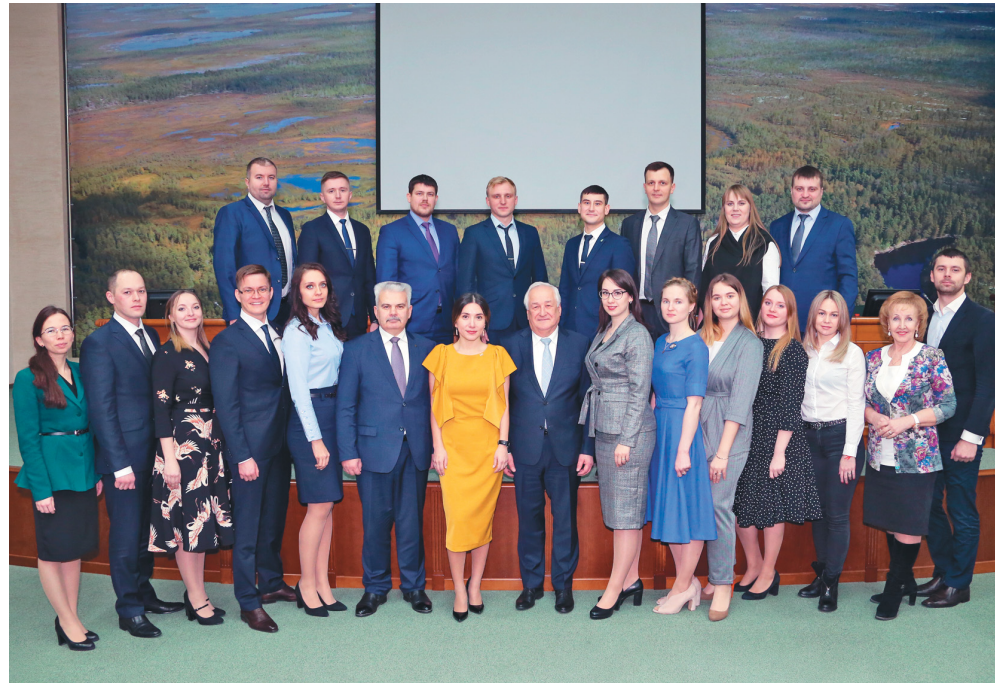
Совет молодёжного объединения с руководством, 2020 год

«Качества характера, присущие молодому поколению, – стремление ко всему новому, нетерпимость к рутине, импульсивность и постоянный творческий поиск. Молодёжные советы компаний, объединённые профсоюзные организации которых входят в Сургутскую районную организацию Нефтегазстройпрофсоюза России, являются для молодых людей хорошей школой отработки и закрепления организаторских способностей, навыков лидерства и успешной реализации молодёжных проектов. Наш корреспондент разузнал об интересных моментах из опыта работы в 2020 году трёх крупных молодёжных организаций нефтегазовых компаний. Сегодня мы расскажем о деятельности Молодёжного объединения ПАО «Сургутнефтегаз».