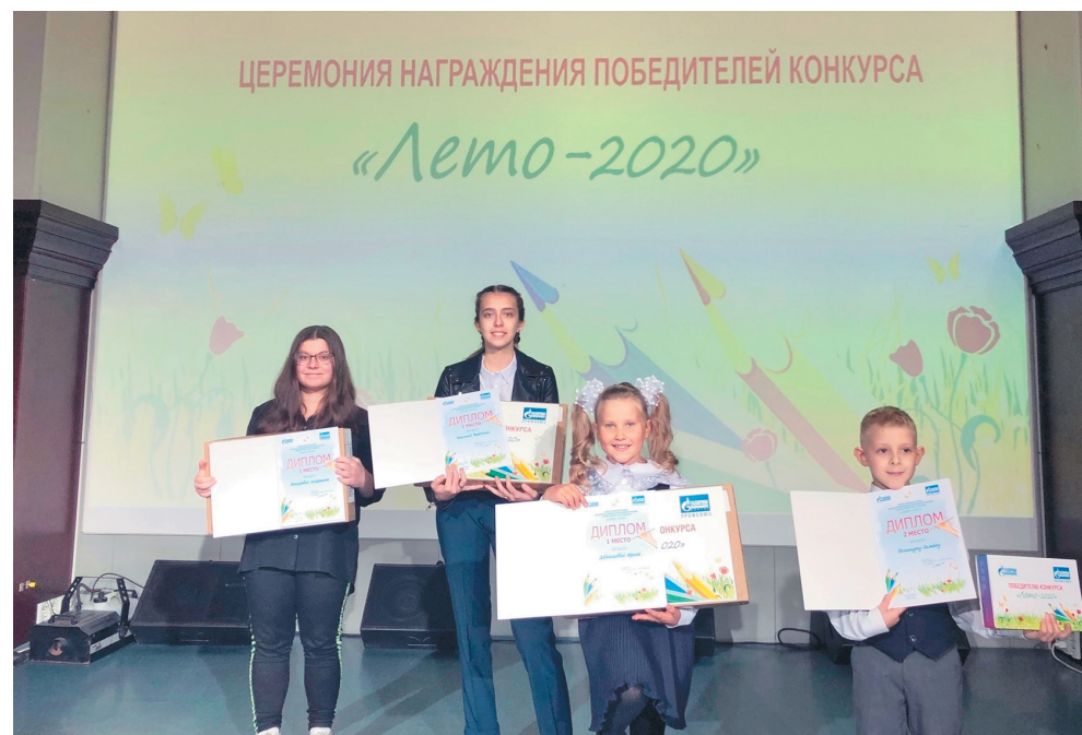
Счастливые лица – высшая награда

В состязании, включающем в себя три этапа, приняли участие дети членов объединённой первичной профсоюзной организации до 18 лет. Победителей определяли в трёх возрастных группах.