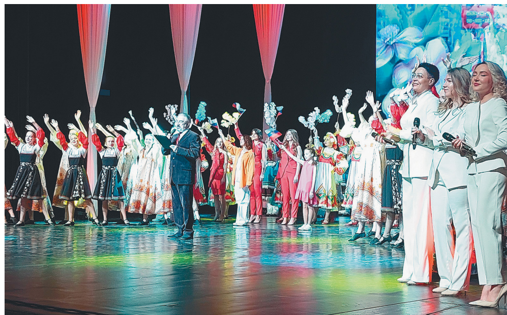
Творческие коллективы Сургута

Дорогие разным поколениям стихи, песни, задорные народные танцы, а также приветствия выступающих создали атмосферу незабываемого праздничного мая.