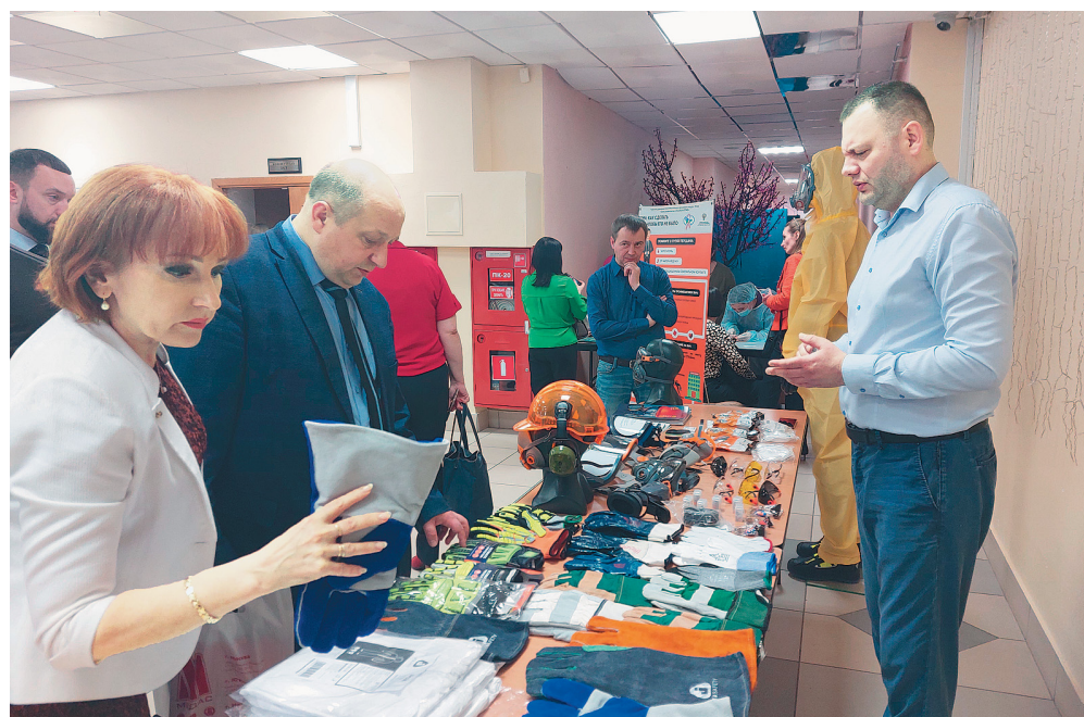
Выставка-дефиле СИЗ на конференции

Безусловно, конференция прошла с пользой и задавала новый импульс активной деятельности в области охраны труда и промышленной безопасности. Системная работа в этом важном деле со стороны органов власти, работодателей и профсоюза позволит качественно реализовать стратегические цели и тактические задачи в области охраны труда в ХМАО-Югре.