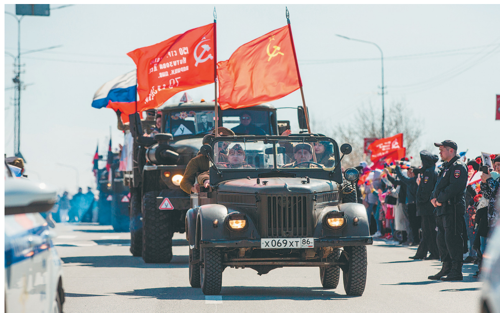
Участники акции «Знамя Победы»

«Бессмертный полк» в Сургуте прошёл в авто- и авиаформатах. В 2023 году по инициативе Центрального штаба общероссийского общественного движения «Бессмертный полк России» форматы участия в акции значительно расширились. Сургутяне не остались в стороне, с гордостью поддержав инициативы движения. Более того, в нашем городе новые форматы в День Победы прозвучали особенно ярко. Фотографии ветеранов можно было напечатать на одежде, изготовить бейдж с портретом героя,