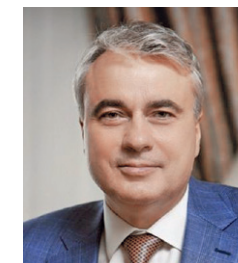
Председатель Комитета Государственной Думы по энергетике Павел Завальный