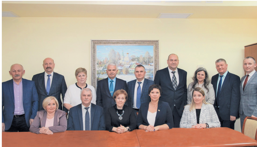
Комитет районной организации

В структуре районной организации профсоюза насчитывается 67 первичных профсоюзных организаций и одна Объединённая первичная профсоюзная