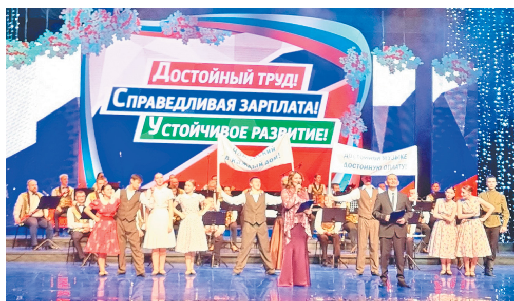
Концертный номер сургутских артистов

Артисты завершили концерт всезнающей и душевной композицией, объединяющей людей и вдохновляющей на новые достижения, «Это наша Россия!». Помимо блестящего выступления со сцены была зачитана традиционная Первомайская