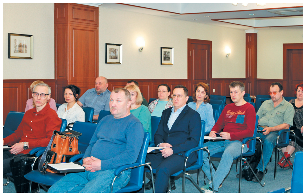
На семинаре для председателей цеховых комитетов ППО

Модератором выступили члены Санкт-Петербургского психологического общества, победители всероссийского конкурса «Активное обучение – эффективный