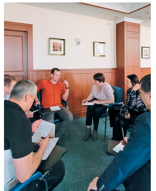
На семинаре для председателей ППО